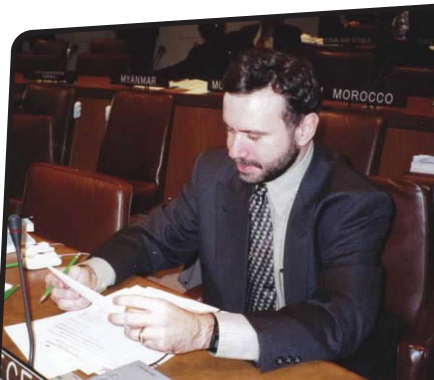
Επιτροπή Δικαιωμάτων ΟΗΕ, 2001

Είμαι καθηγητής Δημοσίου Δικαίου στο Δημοκρίτειο Πανεπιστήμιο Θράκης και έχω διδάξει σε πολλά πανεπιστήμια του εξωτερικού. Τόσο το ακαδημαϊκό μου έργο όσο και η πολιτική μου δραστηριότητα προσανατολίζονται στον ίδιο κοινό στόχο, την υπεράσπιση του Συντάγματος, του Κοινωνικού Κράτους και των δικαιωμάτων. Εκπροσώπησα την Ελλάδα στην Τρίτη Επιτροπή (Δικαιωμάτων) της Γενικής Συνέλευσης του ΟΗΕ και εργάστηκα ως εμπειρογνώμονας σε πολλές χώρες της Ασίας και της Ανατολικής Ευρώπης.