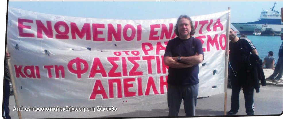
Από αντιφασιστική εκδήλωση στη Ζάκυνθο

Τοποθετήθηκα από την πρώτη στιγμή απέναντι στην απειλή του νεοφασισμού. Επεσήμανα το δισυπόστατο χαρακτήρα της Χρυσής Αυγής, ως πολιτικού κόμματος και εγκληματικής οργάνωσης και την αρχική ολιγωρία διωκτικών αρχών και δικαιοσύνης απέναντί της. Υπογράμμισα, παράλληλα, ότι η πολιτική της δράση θα πρέπει να αντιμετωπισθεί όχι με δικαστικές απαγορεύσεις, αλλά με την ιδεολογική αντιπαράθεση και την απομόνωσή της, δείχνοντας παντού ότι όχι μόνο δεν αποτελεί αντισυστημική δύναμη, αλλά την τελευταία εφεδρεία του συστήματος.