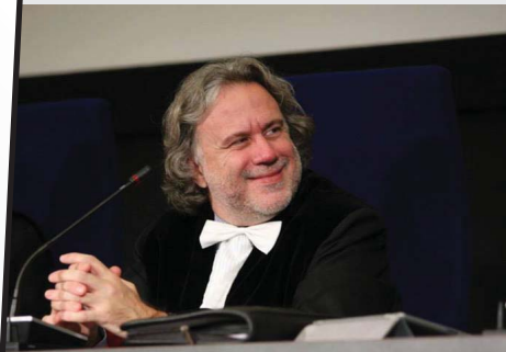
Υποστήριξη διδακτορικού συνεπίβλεψής μου στο Πανεπιστήμιο του Τίλμπουργκ 2013

Υπερασπίζομαι το δημόσιο συμφέρον και τα δικαιώματα στους μαζικούς αγώνες και στα δικαστήρια, σε εμβληματικές υποθέσεις, όπως οι δίκες στο Συμβούλιο της Επικρατείας και την Ευρωπαϊκή Επιτροπή Κοινωνικών Δικαιωμάτων για τα μνημόνια, τις κάμερες, τις ιδιωτικοποιήσεις δημόσιων επιχειρήσεων, την κατάργηση της ΕΡΤ, τη λεγόμενη βασιλική περιουσία.