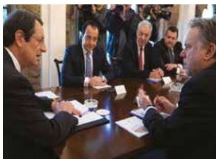
Με τον Πρόεδρο της Κυπριακής Δημοκρατίας Ν. Αναστασιάδη και τον υπουργό Εξωτερικών Ν. Χριστοδουλίδη