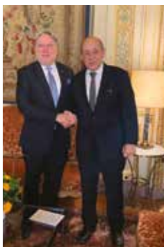
Με τον υπουργό Εξωτερικών της Γαλλίας Ζαν Υβ Λεντριάν