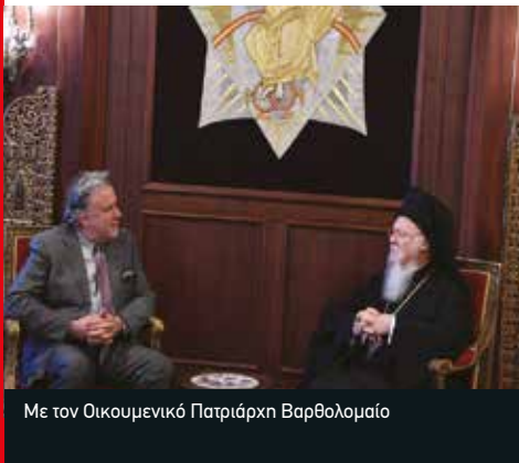
Με τον Οικουμενικό Πατριάρχη Βαρθολομαίο