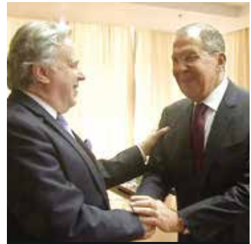
Με τον Υπουργό Εξωτερικών της Ρωσίας Σεργκέϊ Λαβρόφ