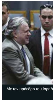
Με τον πρόεδρο του Ισραήλ