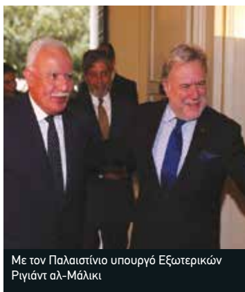
Με τον Παλαιστινίο υπουργό Εξωτερικών Ριγιάτ αλ-Μάλικι