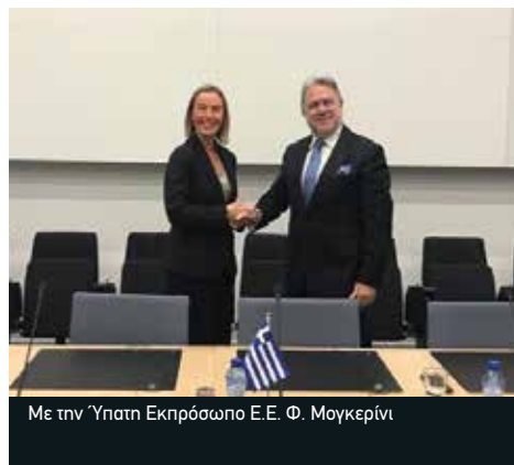
Με την Ύπατη Εκπρόσωπο Ε.Ε. Φ. Μογκερίνι