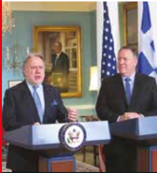
Με τον Υπουργό Εξωτερικών των ΗΠΑ Μάικ Πομπέο